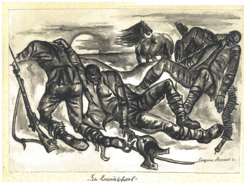
„За „Висота в света““

Със всички и аз по пътеки нелеки понесъл съм жива частица от вас,