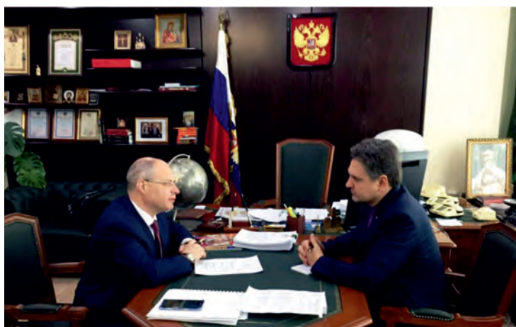
Януари 2018 г., Москва. Със Сергей Гаврилов – Председател на Комисията на Държавната Дума на Руската федерация по развитие на гражданското общество и въпросите на обществените и религиозните обединения в Русия.