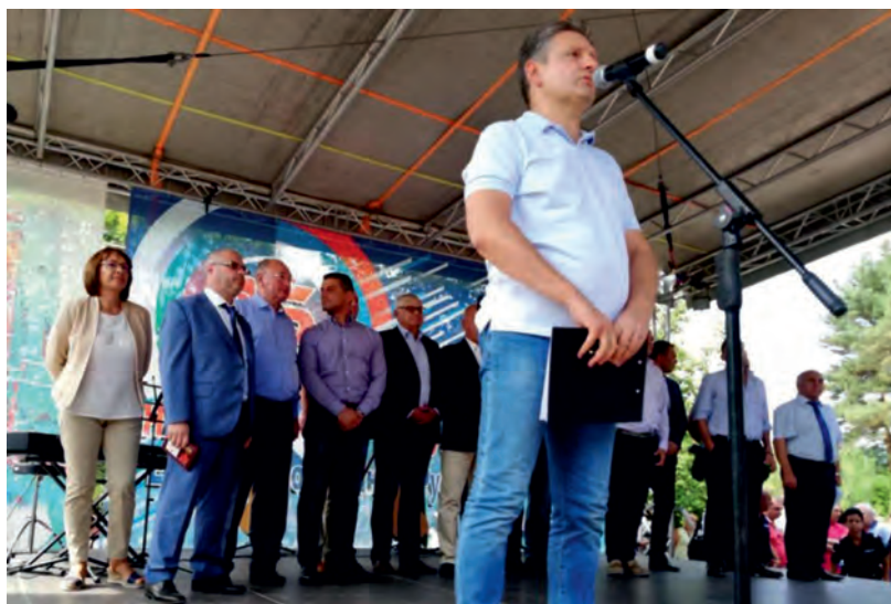
Септември 2018 г., яз. Копринка. Откриване на 15-ти събор на приятелите на Русия.