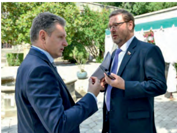
Юни 2019 г., Русия, Крим, гр. Ялта. Пети международен Ливадийски форум. С Константин Косачев – Председател на Комисията по международните въпроси на Съвета на Федерацията на Руската федерация.