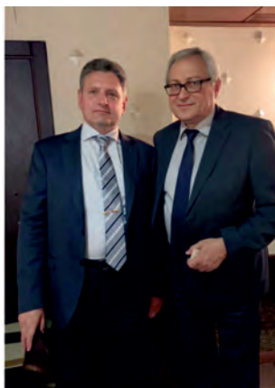
Юли 2019 г., Москва. С Игор Неверов – началник на Управление за външна политика при Администрация на Президента Владимир Путин.