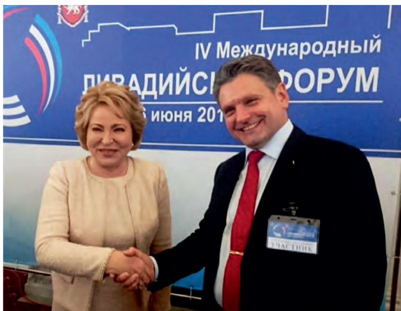
Юни 2018 г., Русия, Крим, гр. Ялта. Четвърти международен Ливадийски форум. С Валентина Матвиенко – Председател на Съвета на Федерацията на Руската федерация.