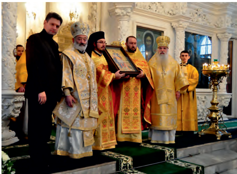
Ноември 2012 г., Русия, гр. Кострома. Национално движение „Русофили“ и Старозагорска митрополия даряват частица от мощите на свети великомъченик Теодор Стратилат на Костромския и Галическия архиепископ Алексий.