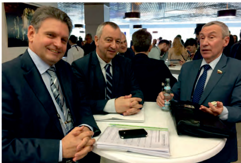
Юни 2018 г., Москва. Международен форум „Развитие на парламентаризма“. С Андрей Климов – Председател на Комисията на Съвета на Федерацията на Руската федерация за защита на държавния суверенитет и предотвратяване на намесата във вътрешните работи и с Георги Пирински – евродепутат от България.