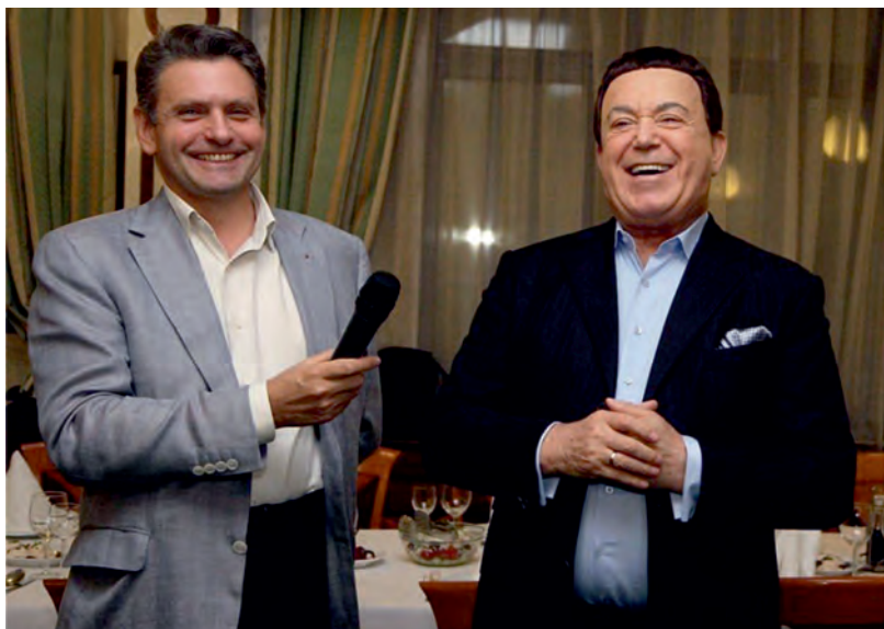
Март 2012 г., София. С н.а. Йосиф Кобзон, съветски и руски поп-певец. Среца с активна на НД „Русофили“.