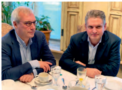
Ноември 2019 г., Москва. С Александър Грушко, заместник министър на външните работи на РФ.