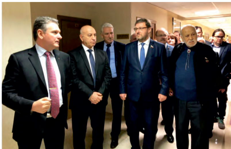
Декември 2018 г., Москва. Федерално събрание на Русия. Откриване на изложба по случай 140-годишнината от Освобождението на България.