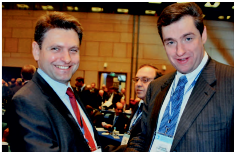
Ноември 2012 г., Москва. С Леонид Слуцкий, Председател на Комисията по международни работи в Държавната Дума на Руската федерация и председател на „Российский Фонд Мира“.