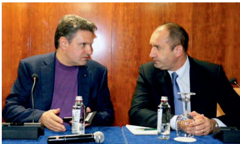
Октомври 2016 г., София. Среца на кандидата за президент Румен Радев с активна на НД „Русофили“.