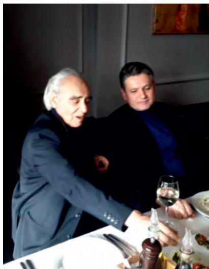
Януари 2018 г., София. С писателя Антон Дончев на следногодишна среща.

Септември 2014 г., София. С писателя и сценариста Анжел Вагенщайн на митинг на 9 септември пред Братската могила в Борисовата градина.