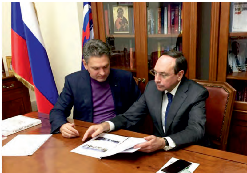
Октомври 2017 г., Москва. Обсъждане с Вячеслав Никонов, председател на Комитета по образование и наука на Руската Държавна Дума, на нова методика за изучаване на руски език в България.